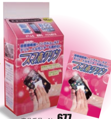
商品番号 No. 677 スマホクリン (ピンク)