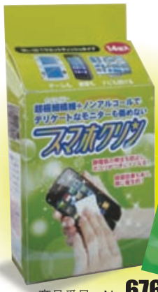
商品番号 No. 676 スマホクリン (グリーン)